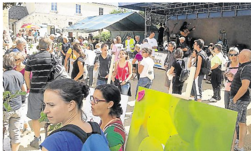
Blaison-Gohier, dimanche. Vignes vins randos dans une petite cité de caractère.

C'était la fête des sens ce dimanche à Blaison-Gohier. 900 randonneurs et 50 cavaliers ont pu marcher, admirer, goûter et aussi rire. Lors de cette 10 e édition de vignes vins randos et des petites cités de caractères, une exposition réalisée par nos habitants ont du talent était présentée dans la collégiale Saint-Aubin. A tout cela s'ajoutait les commerçants du marché dominical étaient également présents pour vendre les produits du terroir. Les randonneurs ont pu découvrir